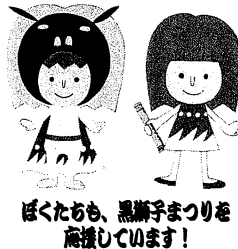
ほくたちも、黒獅子まつりを高揚しています!